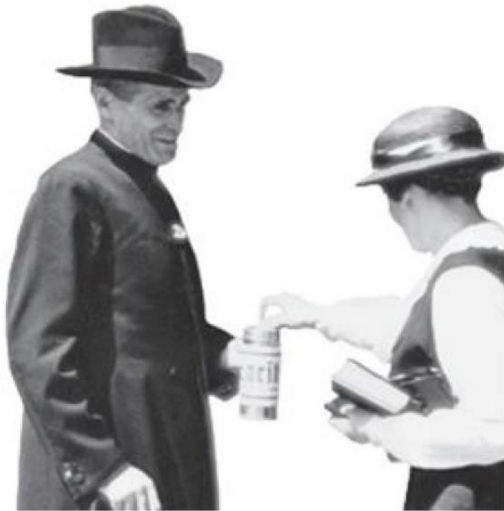
Jesuitenpater Rupert Mayer, Patron der Caritas im Erzbistum, sammelte schon 1935 mit der Caritas-Büchse vor St. Michael in der Münchner Fußgängerzone.

Wann? 30.09. bis 06.10.2024 In unseren Pfarrgemeinden werden Sie wieder Sammlungsbriefe bekommen. Wem kommen die gesammelten Beträge zugute? Die Sammlungsgelder unterstützen und ermöglichen soziale Aufgaben vor Ort. 40 Prozent verbleiben in der Pfarrgemeinde, 60 Prozent gehen an die örtliche Caritas, die damit Dienste finanziert, die nicht ausreichend öffentliche Förderung erhalten, und Menschen in Not beisteht.