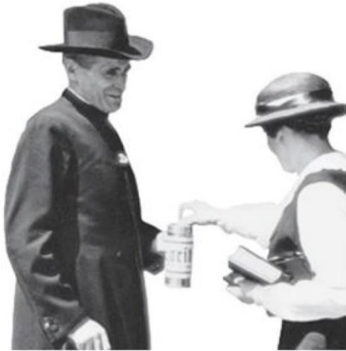
Jesuitenpater Rupert Mayer, Patron der Caritas im Erzbistum, sammelte schon 1935 mit der Caritas-Büchse vor St. Michael in der Münchner Fußgängerzone.